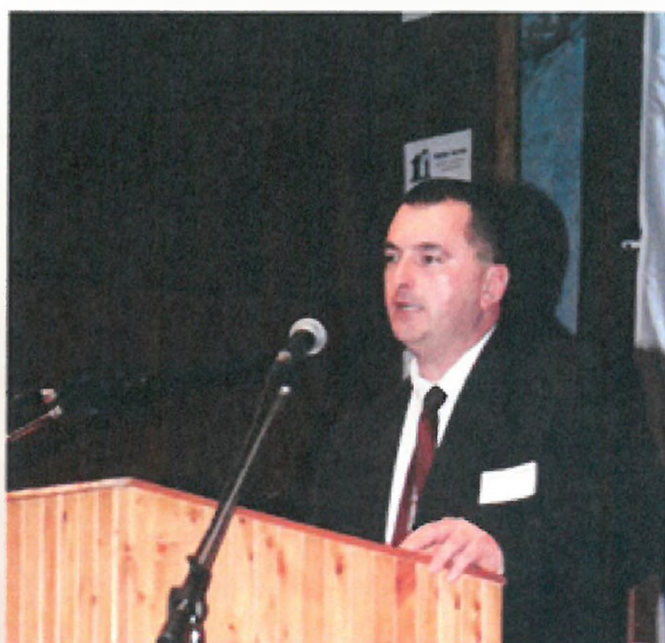
Bakos – TN - NetPressNews

A könyv előreláthatólag 2019-ben jelenik meg Magyarországon és külföldön, legalább 2 kötetben.